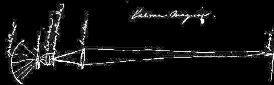
Dibujo considerado la referencia más antigua a la linterna mágica (Manuscrito Codices Hugeniani , Christiaan Huygens, 1659)